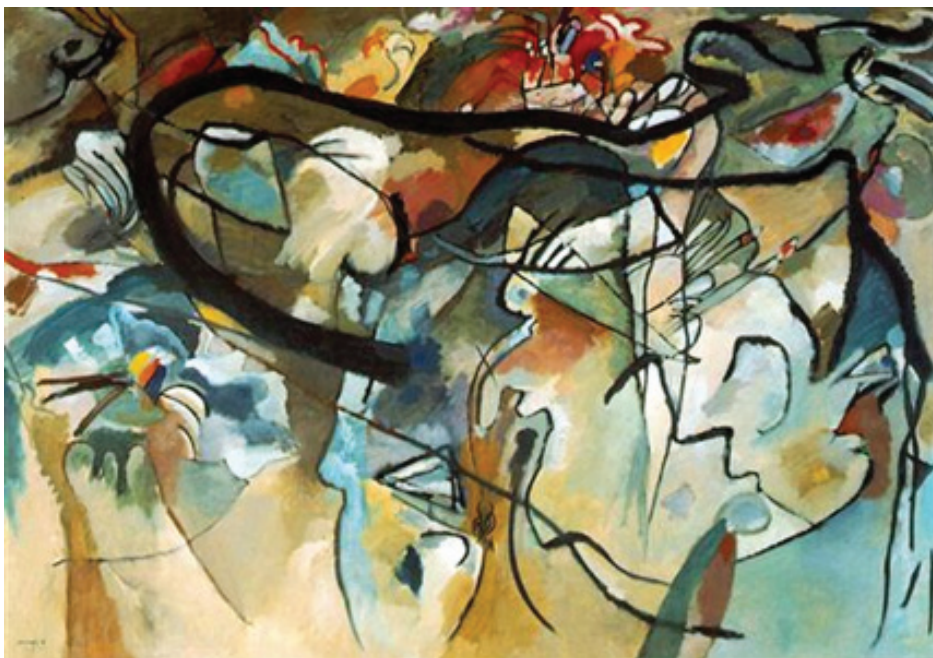
Figura 1 – Wassily Kandinsky. Composição V , 1911