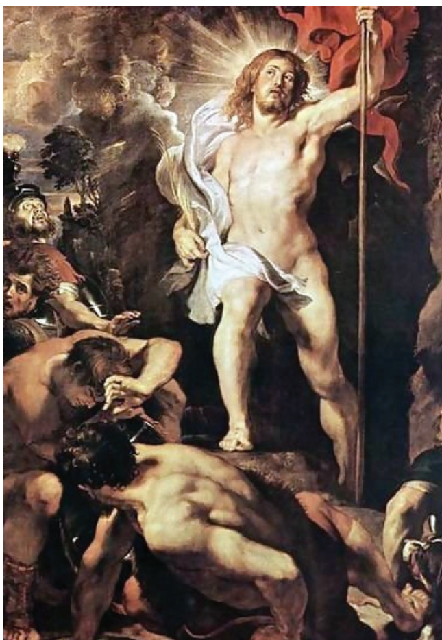
Figura 2 – Peter Paul Rubens. A ressurreição de Cristo [recorte do tríptico], 1611-1612